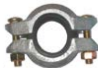
Raccord type VICTAULIC