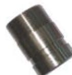
Embout inox fileté pour raccord type VICTAULIC