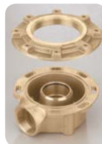
Adaptateur Side Mount

*Le tarif des options ne s'applique que si celles-ci sont commandées avec les vannes.