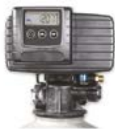
Vanne 5600 SXT